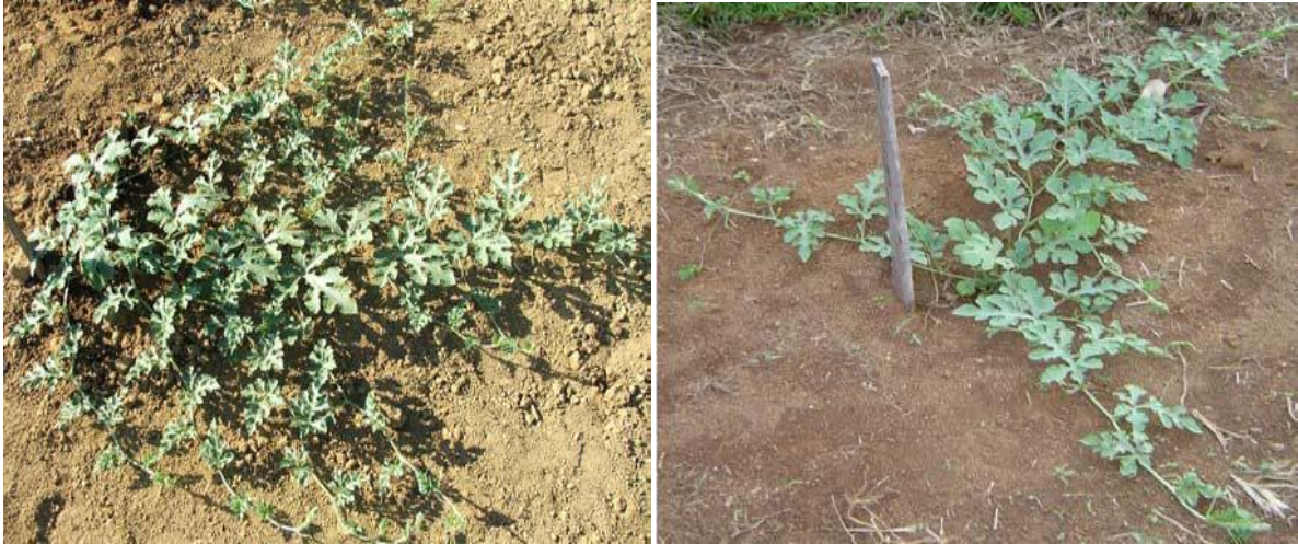
Figura 1. Planta com distribuição dos ramos do tipo axial (esquerda) e radial (direita).

As gavinhas têm a função de fixar as plantas, reduzindo os danos aos ramos, folhas e frutos, sob a ação de ventos (ROSA-NETO et al., 2008). As folhas da melancia são profundamente lobadas e apresentam pilosidades (ALMEIDA, 2003; FILGUEIRA, 2008). Rosa-Neto et al. (2008), complementam dizendo que as folhas da melancia têm disposição alternadas e geralmente apresentam limbo com contorno triangular, recortado em três ou quatro partes de lóbulos e de margens arredondadas. Em algumas variedades as folhas se apresentam inteiras, semelhantes a folhas de melão. Por outro lado, alguns genótipos podem apresentar os lobos subdivididos em lóbulos, formando o que se pode chamar de folhas multilobadas. Rosa-Neto et al. (2008), ainda afirmam que o sistema radicular é do tipo pivotante, mas, a maior concentração das raízes encontra-se até 30 cm abaixo da superfície do solo.