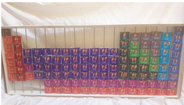
Figura 03: face da tabela com sinais

A figura 03 representa o lado com a linguagem de sinais dos elementos químicos da tabela periódica.