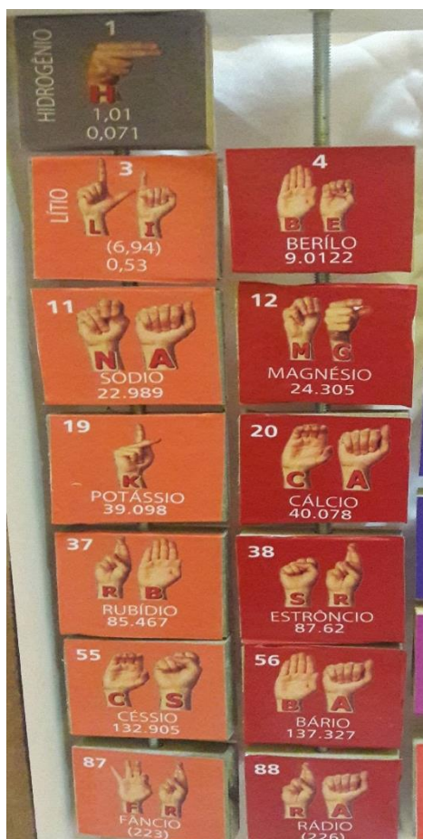
Figura 04: Família 01 A e 02 A