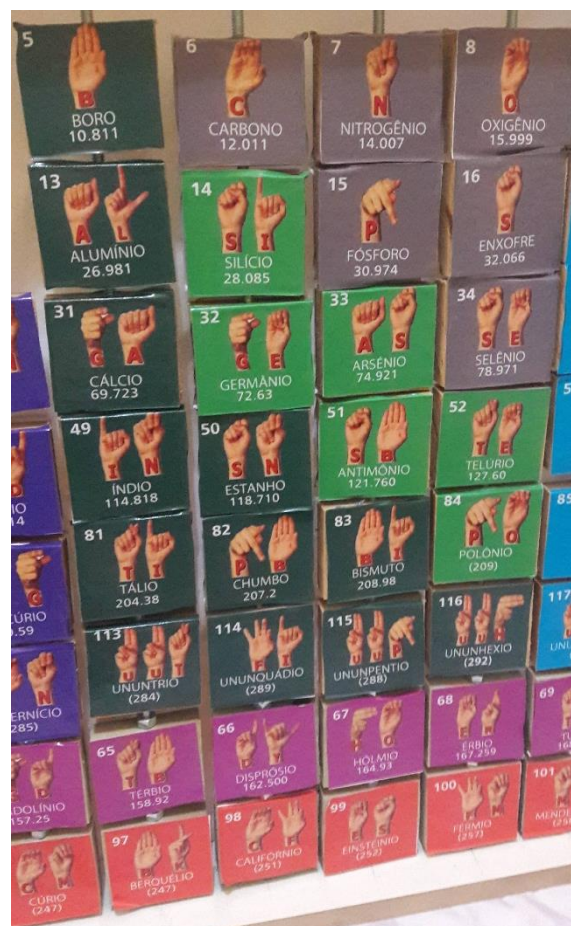
Figura 05: Família 03 A, 04 A, 05 A, 06 A