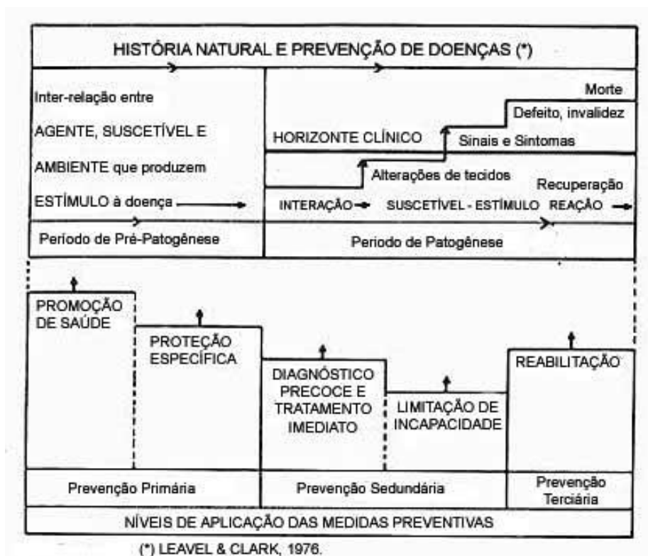
Figura 2 - História Natural da Doença e Níveis de Prevenção