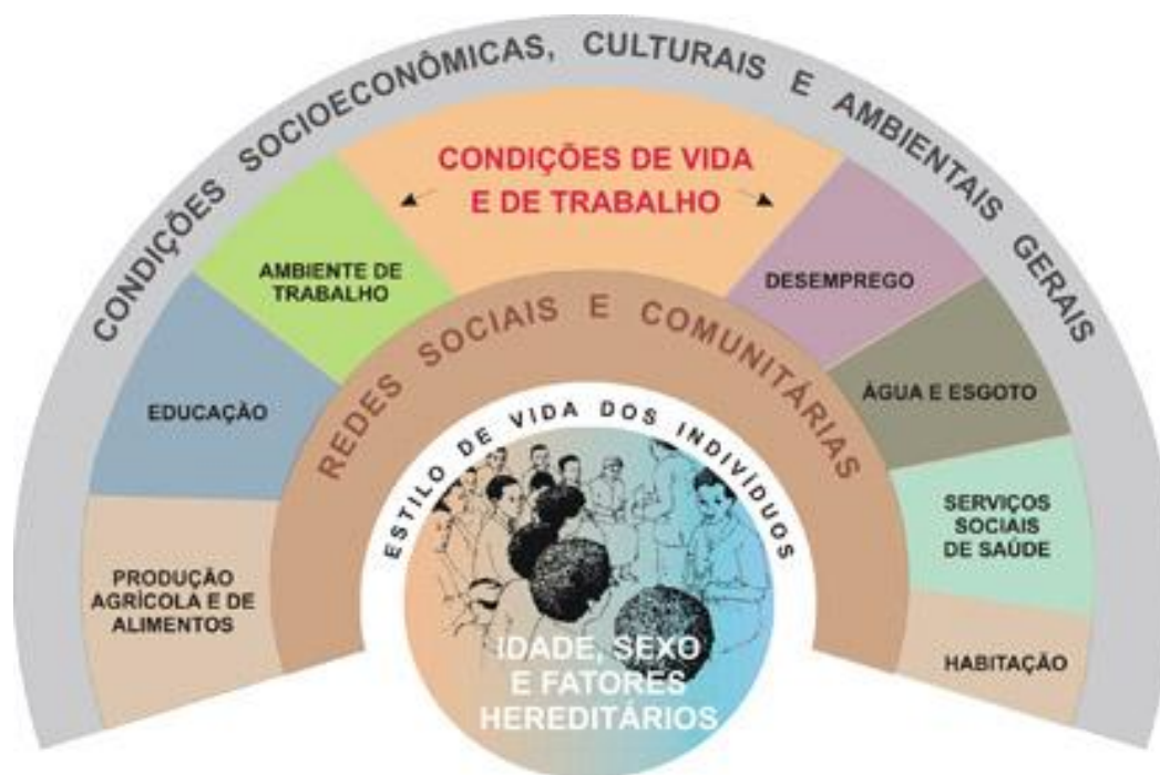
Figura 1 - Modelo de determinação social da saúde proposto por Dahlgren e Whitehead