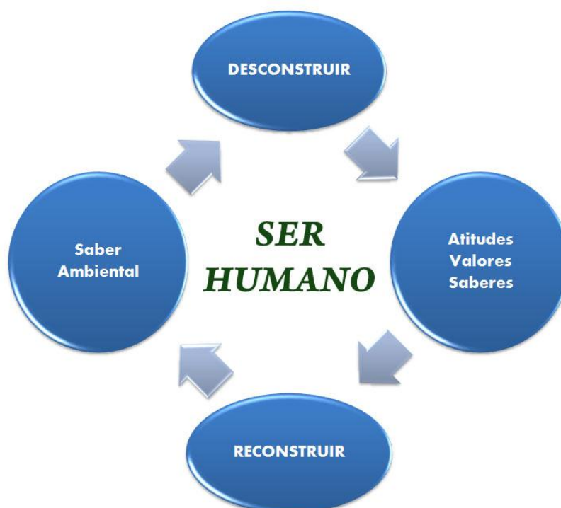
Figura 1 – Tetradiensão da sensibilização e fomento da aprendizagem ao longo do tempo, com gênese de novos valores atitudes e saberes.

escolas e que levam a expressões de bullying, depredação do patrimônio público, da carência do exercício da cidadania e de comportamentos ambientalmente irresponsáveis [12].