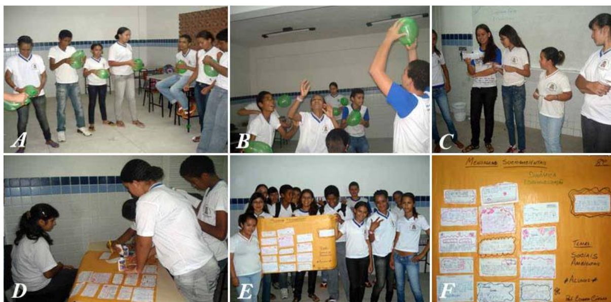
Figura 3 – Atividade lúdica com as etapas da Dinâmica de Ecosocialização: A) Alunos em círculo com bexigas de aniversário cheias de ar, amarradas e dentro delas palavras-chaves de estímulo ao debate; B) Momento da realização da parte empírica, com movimentação das bexigas no ar, que se misturam e posteriormente são estouradas, para coletar as palavras-chave e realizar a leitura reflexiva-crítica com debates; C) Momento da leitura das palavras-chave e início do diálogo sobre cada uma delas em coletivo; D) Momento da produção textual das frases para serem fixadas na folha de papel madeira e formar um painel reflexivo

a sua escolha sobre as palavras-chave e tudo o que havia ocorrido durante o diálogo sem sala (Figura 3-D e E). Estas frases – reflexões críticas – foram escritas em recortes de papel medindo 15x5cm e foram dispostas sobre a folha de papel madeira, compondo um painel que foi fixado na sala de aula, e que serviu a partir de então, como recordação e inspiração para sempre olharem para o mesmo e se reconhecerem no mento lúdica da construção de novos saberes, atitudes e valores no ambiente escolar (Figura 3-F).