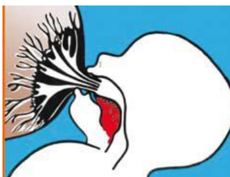
Figura 2-pega Inadequada

As primeiras semanas da amamentação podem ser uma fase difícil, sobretudo para as mães que estão amamentando pela primeira vez. Orientação a respeito de uma pega adequada no processo de amamentação faz-se de suma importância, salientando que a criança deve abocanhar todo o mamilo e quase toda aréola, se isso não acontecer poderá machucar a mama e causar dores e desconfortos para a mãe (MATUHARA; NAGANUMA, 2006).