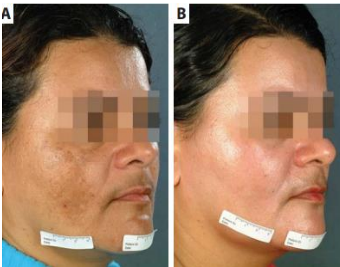
Figura 3- Melhora clínica total da hemiface direita, tratada com hidroquinona a 4% Fonte: Moreira et al. (2010)

Um estudo duplo-cego, controlado randomizado, foi realizado com 30 mulheres que aplicaram a hidroquinona 4% em um lado da face e no outro lado o placebo. Depois de três meses ocorreu melhora geral de 72% da hemiface tratada em comparação com o placebo (Figura 3). O Grupo da hidroquinona teve melhora de 76,9%, tendo 25% de efeitos colaterais leves (MOREIRA et al., 2010).