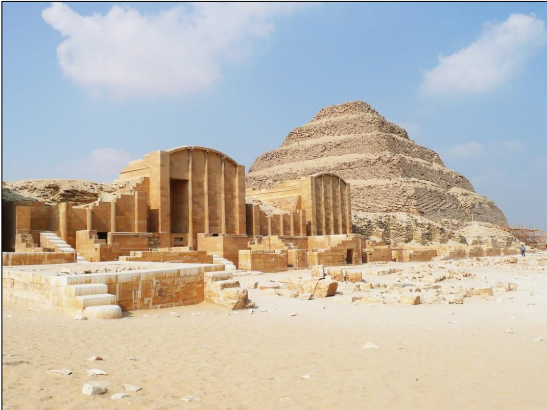
Figura 2 – Pirâmide Escalonada (Egito)

Com o fortalecimento do Império Egípcio (3.000 a 1.000 anos a.C.), as construções começaram a se aprimorar. Nesse momento o barro era utilizado para fabricação de tijolos e as argamassas de gipsita e de cal eram utilizadas para construção das estruturas que precedem as pirâmides (mastabas). A Pirâmide Escalonada (Figura 2) é tida como a primeira grande construção utilizando concreto natural nesse período e foi construída por volta de 2.660 anos a.C. (HELENE; ANDRADE, 2007).