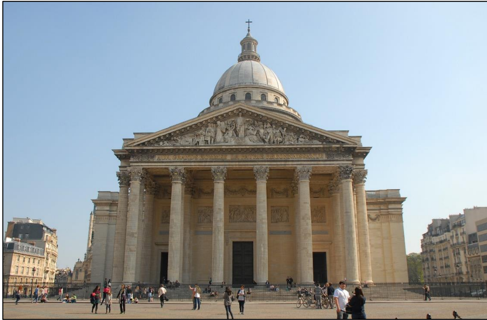
Figura 6 – Igreja de Santa Genoveva (França)

tração e compressão das estruturas, que no futuro seria denominado de concreto armado (GIONGO, 2007).