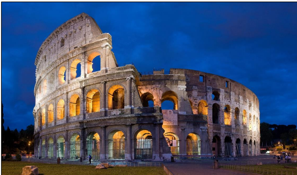
Figura 4 – Coliseu (Itália)

A primeira concepção de concreto surge com o Império Romano (300 anos a. C.), trata-se do “concreto romano”. Esse concreto era obtido a partir da mistura de componentes como água, areia, cal e Pozzolona, que era um material rochoso encontrado no Vulcão Vesúvio, em Pozzuoli (Itália). Um grande exemplo de construções dessa época é o Coliseu (Figura 4). Esse período é compreendido como um grande marco na evolução das construções (PINHEIRO, 2018).