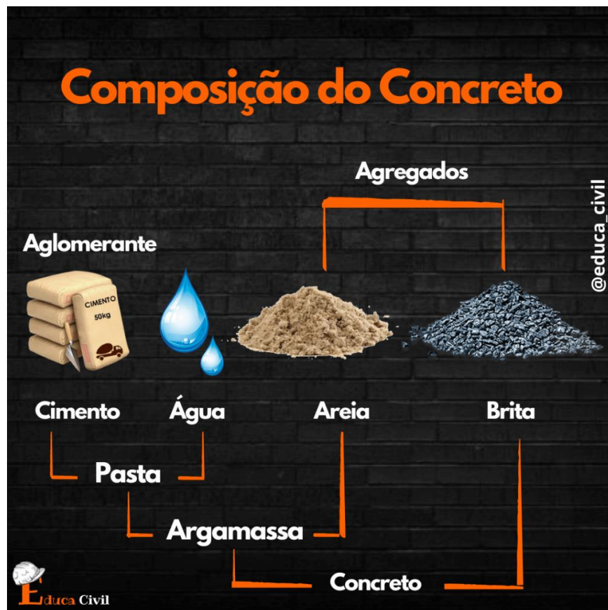
Figura 7 – Composição do concreto

A Figura 7 apresenta o esquema de composição do concreto.