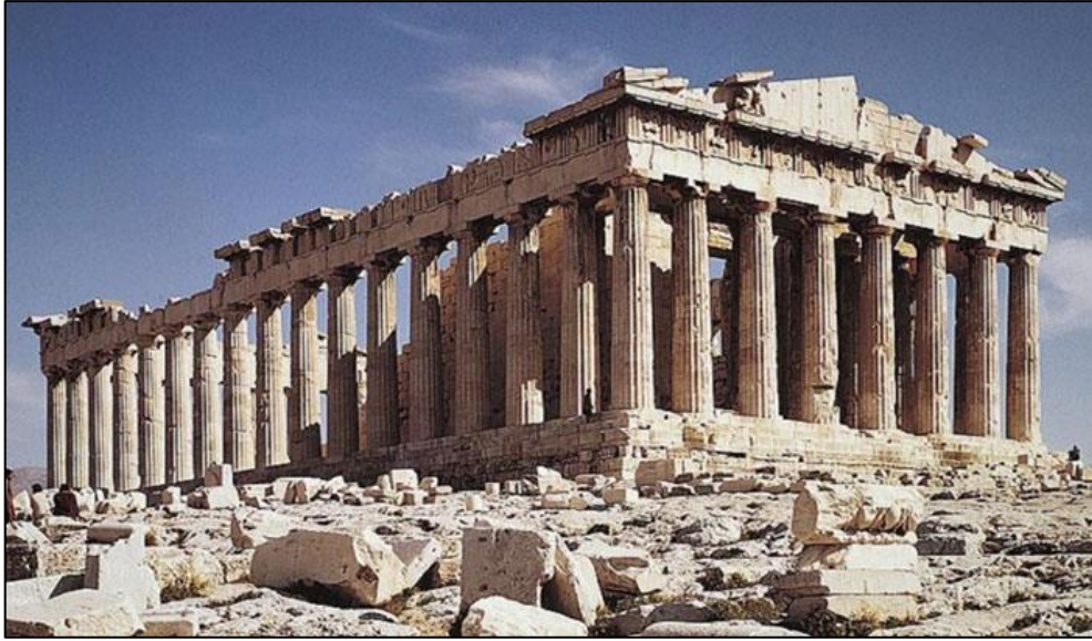
Figura 3 – Templo Parthenon (Grécia)