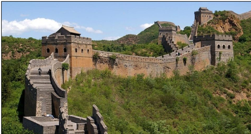
Figura 8 – Grande Muralha da China

Em outros lugares do mundo, a prática também é comum. No Brasil, tal prática também era comum mesmo antes do surgimento do cimento Portland, visto que muitas obras utilizavam a adição de óleo de baleia na argamassa para melhoria do desempenho de plasticidade. Além disso, também há registros que a clara de ovo foi utilizada na construção da Muralha da China (Figura 8) (CORRÊA, 2010).