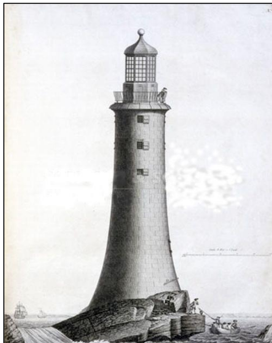
Figura 5 – Farol de Eddystone (Inglaterra)

Um ponto importante que deve ser abordado é a reconstrução do Farol de Eddystone (Figura 5), na Inglaterra. Tal feito aconteceu entre 1756 e 1793 e foi elaborado por John Smeaton e é considerado um marco na evolução do concreto, visto que os experimentos determinaram as características fundamentais do cimento hidráulico (LUZ, 2015).