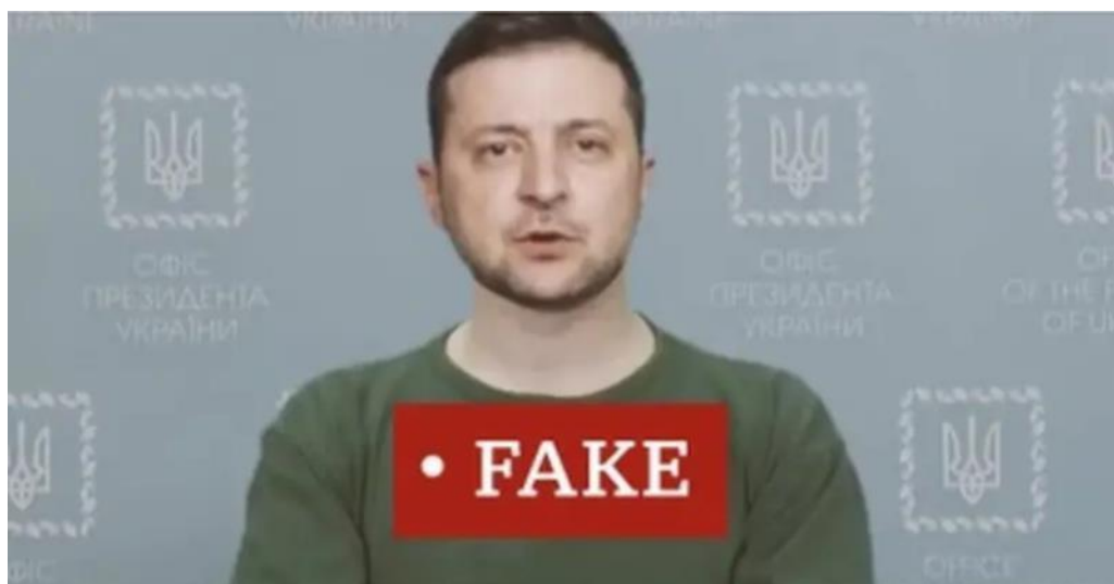
Figura 3 - Volodymyr Zelensky em discurso